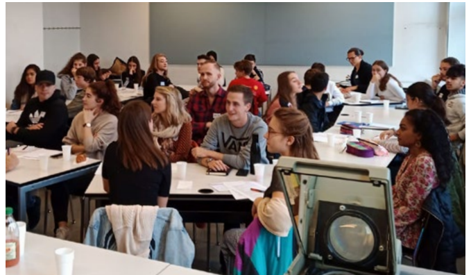
RYL! Winterthur, Mentoring-Jahrgang 2019–2021

Dabei steht jeweils der gemeinsame Austausch im Vordergrund. Die MentorInnen sollen sich gegenseitig coachen und Tipps geben. Natürlich ist es auch eine optimale Möglichkeit, andere Programm-TeilnehmerInnen besser kennenlernen zu können.