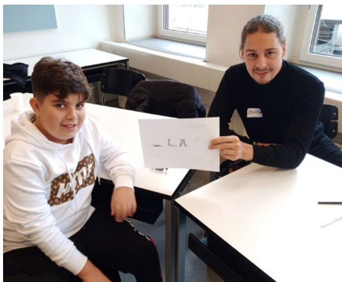
Matching des Jahrgangs 2019–2021, 2.11.2019

Dies hat ein Mentor beim Bewerbungsgespräch gesagt, und recht hat er! Unsere Mentees und MentorInnen befinden sich beide auf einem lehrreichen Weg, den sie gemeinsam begehen wollen. Dabei steht das Lernen, das Weiterkommen aber auch die Freude an der Zusammenarbeit auf dem Programm.